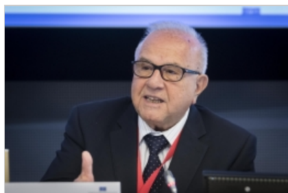
Kina i oktober 2019. (mp)

På initiativ av EESK-ledamoten Antonello Pezzini tog kommittén emot en delegation av företrädare för Kinas tillsynsmyndigheter den 9 juli 2019.