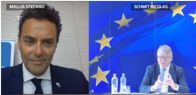
Meeting of EESC Employers' Group with Commissioner Schmit 15 April 2021