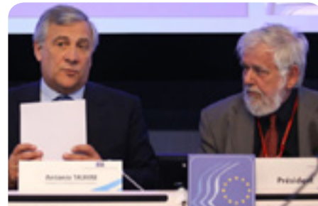
Predsednik EP Antonio Tajani in predsednik EESO Georges Dassis

Predsednik EP Antonio Tajani se je v četrtek, 1. junija, udeležil plenarnega zasedanja EESO, na katerem je spregovoril o prednostnih nalogah Parlamenta ter krepitvi sodelovanja med institucijama.