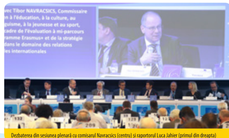
Dezbaterea din sesiunea plenară cu comisarul Navracsics (centru) și raportorul Luca Jahier (primul din dreapta)

UE are nevoie de un plan concret pentru a promova cultura ca element vital în cadrul unor societăți deschise și tolerante. CESE a organizat o dezbatere cu comisarul Navracsics și și-a adoptat avizul