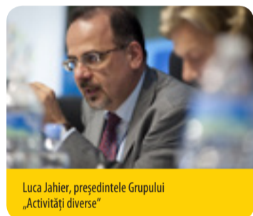
Luca Jahier, președintele Grupului „Activități diverse”

La treizeci de ani de la definirea conceptului de dezvoltare durabilă, viitorul nostru comun este pus efectiv în pericol. Într-un moment în care alții își reneagă angajamentele, este imperativ ca UE să își mențină dinamica, asumându-și schimbarea , accelerându-i ritmul și investind în ea. Momentul este prielnic pentru un angajament pe termen lung, spre a asigura tranziția la o economie favorabilă incluziunii, echitabilă, rezilientă, cu emisii scăzute de dioxid de carbon, circulară și colaborativă. A venit vremea ca liderii politici să regândească modelele noastre de creștere economică și să îmbunătățească calitatea vieții cetățenilor. Acum trebuie găsit un echilibru între prosperitatea economică, inovare, incluziunea socială, participarea democratică și durabilitatea mediului, în interiorul frontierelor noastre globale.