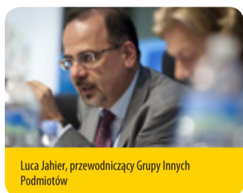
Luca Jahier, przewodniczący Grupy Innych Podmiotów

Trzydzieści lat po zdefiniowaniu pojęcia zrównoważonego rozwoju nasza wspólna przyszłość jest poważnie zagrożona. W czasach, gdy co niektórzy wycofują się ze swoich zobowiązań, UE musi koniecznie podtrzymać dynamikę , przyspieszając zachodzące przemiany, inwestując w nie i je wykorzystując . Nadszedł czas na długoterminowe zaangażowanie, by przejść na sprawiedliwą, odporną, niskoemisyjną gospodarkę o obiegu zamkniętym, opartą na współkonsumpcji i sprzyjającą włączeniu społecznemu. Nadszedł czas politycznego przywództwa – by przemyśleć nasze modele wzrostu i poprawić jakość życia, by doprowadzić do zrównoważenia w skali globalnej dobrobytu gospodarczego z innowacjami, włączeniem społecznym, uczestnictwem demokratycznym i zrównoważeniem środowiskowym. Musimy z przekonaniem i odwagą