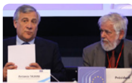
Przewodniczący PE Antonio Tajani z przewodniczącym EKES-u Georges'em Dassisem

Przewodniczący PE Antonio Tajani przyłączył się do sesji plenarnej EKES-u w czwartek, 1 czerwca, by przedyskutować priorytety PE i umocnienie współpracy między obiema instytucjami.