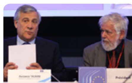
Przewodniczący PE Antonio Tajani z przewodniczącym EKES-u Georges'em Dassisem

Przewodniczący PE Antonio Tajani przyłączył się do sesji plenarnej EKES-u w czwartek, 1 czerwca, by przedyskutować priorytety PE i umocnienie współpracy między obiema instytucjami.