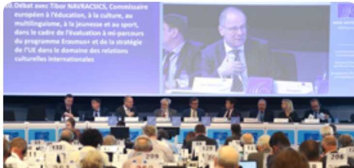
Plenaire debat met EU-commissaris Navracsics (in het midden) en rapporteur Luca Jahier (uiterst rechts)

De EU heeft een concreet plan nodig om cultuur te promoten als een essentieel element van een open en tolerante samenleving. Het EESC organiseerde een debat met commissaris Navracsics en stemde via zijn advies over de EU-strategie voor internationale culturele betrekkingen.