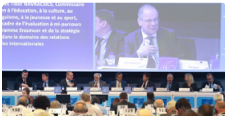
Dibattitu tal-plenarja mal-Kummissarju Navracsics (fin-nofs) u r-relatur Luca Jahier (l-ewwel mil-lemin)

L-UE teħtieġ pjan konkret biex tippromovi l-kultura bħala element essenzjali f'soċjetajiet miftuħa u tolleranti. Il-KESE kellu dibattitu mal-Kummissarju Navracsics u vvota permezz tal-Opinjoni tiegħu