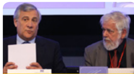
EP Pirmininkas Antonio Tajani su EESRK pirmininku Georges Dassis

EP Pirmininkas Antonio Tajani dalyvavo birželio 1 d., ketvirtadienį, vykusioje EESRK plenarinėje sesijoje, kurioje buvo aptarti EP prioritetai ir abiejų institucijų bendradarbiavimo stiprinimas.