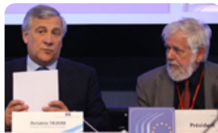
Antonio Tajani EP-elnök és Georges Dassis EGSZB-elnök

Antonio Tajani, az Európai Parlament elnöke részt vett az EGSZB június 1-jén, csütörtökön tartott plenáris ülésén, hogy megvitassa az Európai Parlament prioritásait és a két intézmény közötti együttműködés erősítését.