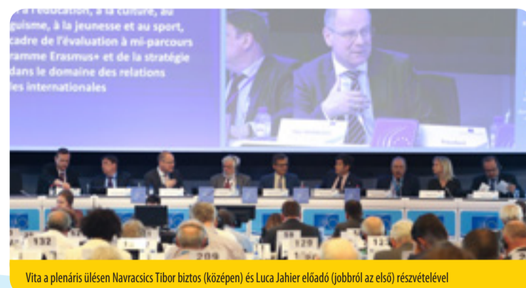
Vita a plenáris ülésen Navracsics Tibor biztos (középen) és Luca Jahier előadó (jobbról az első) részvételével

Az EU-nak konkrét tervre van szüksége, hogy segítse a kultúrát, amely létfontosságú elem minden nyitott, toleráns társadalomban. Az EGSZB Navracsics Tibor biztos részvételével vitát rendezett erről a kérdéstről, és véleményében szót emelt a nemzetközi