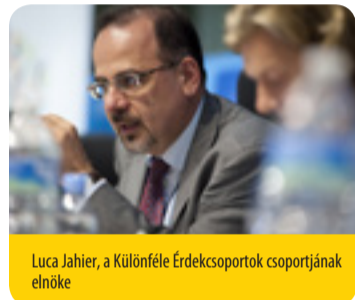
Luca Jahier, a Különböző Érdekcsoportok csoportjának elnöke

Harminc évvel a fenntartható fejlődés fogalmának meghatározása után közös jövőnk sok veszély fenyegeti. Egy olyan időszakban, amikor mások hátat fordítanak kötelezettségvállalásainknak, nagyon fontos, hogy az EU fenntartsa a lendületet , felgyorsítsa, ösztönözze és elfogadva a változást . Itt az ideje a hosszú távú szerepvállalásnak, az inkluzív, méltányos, ellenállóképes, alacsony szén-dioxid-kibocsátású, körforgásos és közösségi gazdaságra való átmenet megvalósítása érdekében. Itt az ideje a politikai vezető szerepnek , hogy újra átgondoljuk növekedési modelljeinket és tovább növeljük a jólétet. Meg kell találni az egyensúlyt a gazdasági prosperitás és az innováció, a társadalmi integráció, a demokratikus részvétel és a környezeti fenntarthatóság között, mindez globális méretekben. Meggyőződésre és bátorságra van szükségünk ahhoz, hogy megvédjük az ENSZ 2030-ig