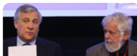
Predsjednik EP-a Antonio Tajani s predsjednikom EGSO-a Georgesom Dassisom

Predsjednik EP-a Antonio Tajani sudjelovao je na plenarnoj sjednici EGSO-a u četvrtak, 1. lipnja radi rasprave o prioritetima EP-a i jačanju suradnje između dviju institucija.