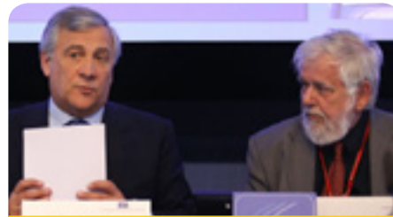
EP president Antonio Tajani EMSK presidendi Georges Dassisega

„Kolm peamist väljakutset, millele me peame ühiselt vastama, on töötus (iseäranis noorte töötus), ränne ja terrorism,“ ütles Antonio Tajani.