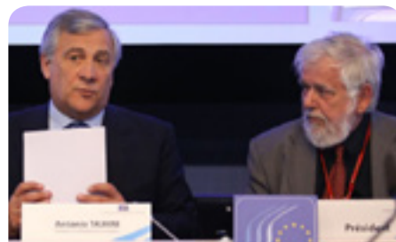
El presidente del PE, Antonio Tajani, con el presidente del CESE, Georges Dassis.

El jueves 1 de junio, el presidente del Parlamento Europeo, Antonio Tajani, asistió al Pleno del CESE para debatir sobre las prioridades del PE y reforzar la cooperación entre las dos instituciones.