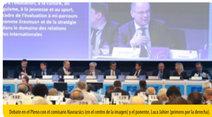
Debate en el Pleno con el comisario Navracsics (en el centro de la imagen) y el ponente, Luca Jahier (primero por la derecha).

La UE requiere un plan específico para defender la cultura como aspecto fundamental de unas sociedades abiertas y tolerantes. El CESE mantuvo un debate con el comisario Navracsics y sometió a votación su dictamen sobre la estrategia de la UE para las relaciones culturales internacionales.