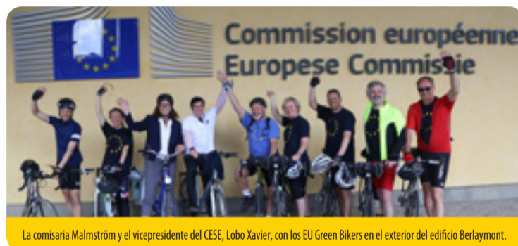
La comisaria Malmström y el vicepresidente del CESE, Lobo Xavier, con los EU Green Bikers en el exterior del edificio Berlaymont.

El 31 de mayo, el vicepresidente del CESE, Gonçalo Lobo Xavier, y la comisaria europea de Comercio, Cecilia Malmström, recorrieron con los EU Green Bikers el primer kilómetro de su vuelta anual, que este año los llevará a Essen (Alemania).