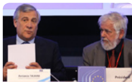
El presidente del PE, Antonio Tajani, con el presidente del CESE, Georges Dassis.

El jueves 1 de junio, el presidente del Parlamento Europeo, Antonio Tajani, asistió al Pleno del CESE para debatir sobre las prioridades del PE y reforzar la cooperación entre las dos instituciones.