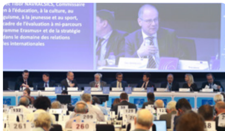
Debat med kommissær Tibor Navracsics (i midten) og ordfører Luca Jahier (yderst til højre) på EØSU's plenarforsamling

EU har brug for en konkret plan, der kan promovere kultur som et centralt element i åbne, tolerante samfund. EØSU har haft en debat med deltagelse af kommissær Navracsics og har vedtaget sin udtalelse om EU's strategi for internationale kulturelle forbindelser.