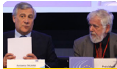
Председателите на ЕП Антонио Таяни и председателите на ЕИСК Жорж Дасис

Председателят на ЕП Антонио Таяни участва в пленарната сесия на ЕИСК на 1 юни, четвъртък, където обсъди приоритетите на ЕП и укрепването на сътрудничеството между двете институции.