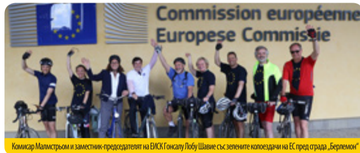
Комисар Малмстрьом и заместник-председателят на ЕИСК Гонсалу Лобу Шавие със зелените колоездачи на ЕС пред сградата „Берлемон“

Конкурсът, проведен за първи път, беше организиран от Европейската комисия и осъществен от фондацията Finnova в сътрудничество с Startup Europe. Целта му е да идентифицира вдъхновяващи примери, които могат да помогнат за развиването на предприемачеството в Европа. Както и голяма част от работата на ЕИСК, конкурсът е съсредоточен върху установяването на устойчиви модели на растеж и инвестиционни стратегии за създаване на работни места и превръщане на ЕС в ресурсно ефективна и конкурентоспособна икономика. (mre) ●