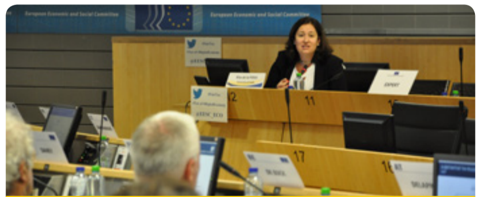
Проф. Рита де ла Ферия на дебата относно данъчното облагане на цифровата икономика

„Нуждаем се от по-единна данъчна система в Европа. Икономиката ни не е обвързана с територията, така че би трябвало да я третираме, използвайки единен европейски подход“, заяви Джузепе Гуерини (група „Други интереси“ — IT), докладчик по становището на ЕИСК относно данъчното облагане в рамките на икономиката на споделянето. ●