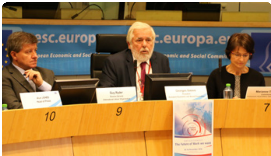
Od leve proti desni: generalni direktor MOD Guy Rider, predsednik EESO Georges Dassis in evropska komisarka Marianne Thyssen med tiskovno konferenco o prihodnosti dela

EESO in Mednarodna organizacija dela (MOD) sta 15. in 16. novembra 2016 v Bruslju organizirala dialog na visoki ravni na temo prihodnosti dela . Udeležilo se ga je več kot 300 predstavnikov evropskih socialnih partnerjev ter civilne družbe. Otvorjene nagovore so imeli predsednik EESO Georges Dassis, pred kratkim ponovno izvoljeni generalni direktor MOD Guy Ryder in evropska komisarka Marianne Thyssen.