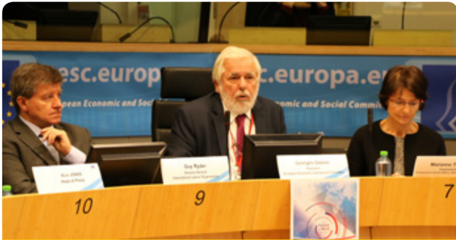
Od lewej: dyrektor generalny MOP Guy Rider, przewodniczący EKES-u Georges Dassis i komisarz europejska Marianne Thyssen podczas konferencji prasowej „Przyszłość pracy”

W dniach 15–16 listopada 2016 r. EKES i Międzynarodowa Organizacja Pracy (MOP) zorganizowała w Brukseli dialog wysokiego szczebla w sprawie przyszłości pracy . Uczestniczyło w nim ponad 300 przedstawicieli europejskich partnerów społecznych i społeczeństwa obywatelskiego. Na sesji inauguracyjnej zabrali głos przewodniczący EKES-u Georges Dassis, Guy Rider, niedawno ponownie wybrany na dyrektora generalnego MOP i komisarz europejska Marianne Thyssen.