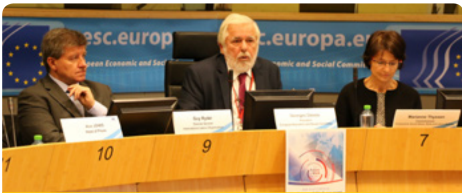
Van links naar rechts: IAO-directeur-generaal Guy Rider, EESC-voorzitter Georges Dassis en Europees commissaris Marianne Thyssen tijdens de persconferentie over De toekomst van werk

Op 15 en 16 november 2016 voerden het EESC en de Internationale Arbeidsorganisatie (IAO) in Brussel een dialoog op hoog niveau over de Toekomst van werk . Deze dialoog werd bijgewoond door meer dan 300 vertegenwoordigers van Europese sociale partners en het maatschappelijk middenveld. De openingszitting werd verzorgd door EESC-voorzitter Georges Dassis, de onlangs herkozen directeur-generaal van de IAO Guy Ryder en eurocommissaris Marianne Thyssen.