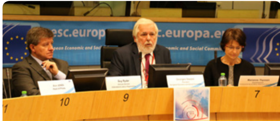
No kreisās uz labo: SDO ģenerāldirektors Guy Rider, EESK priekšsēdētājs Georges Dassis un Eiropas komisāre Marianne Thyssen preses konferencē par darba nākotni

EESK un Starptautiskā Darba organizācija (SDO) 2016. gada 15. un 16. novembrī Briselē rīkoja augsta līmeņa dialogu par darba nākotni . Konferencē piedalījās vairāk nekā 300 dalībnieku, kas pārstāvēja Eiropas sociālos partnerus un pilsonisko sabiedrību. Atklāšanas sēdē uzstājās EESK priekšsēdētājs Georges Dassis, atkārtoti ievēlētais SDO ģenerāldirektors Guy Rider un Eiropas komisāre Marianne Thyssen.