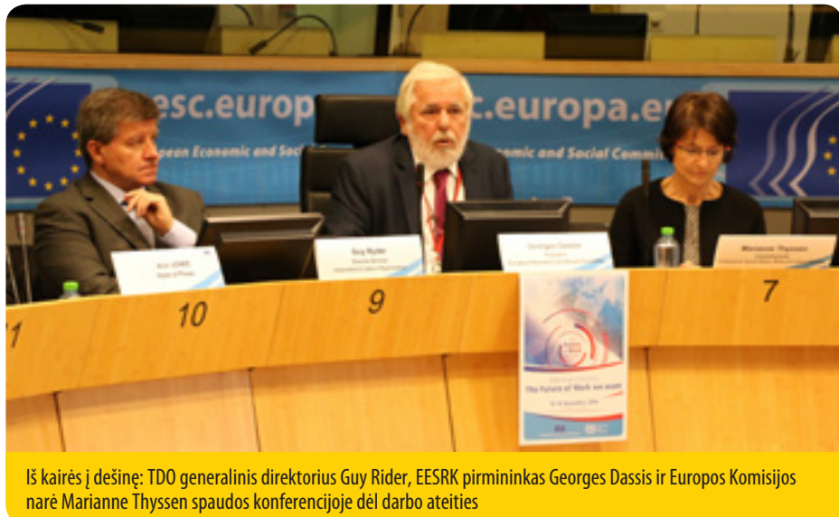
Iš kairės į dešinę: TDO generalinis direktorius Guy Rider, EESRK pirmininkas Georges Dassis ir Europos Komisijos narė Marianne Thyssen spaudos konferencijoje dėl darbo ateities

2016 m. lapkričio 15–16 d. Europos ekonomikos ir socialinių reikalų komitetas kartu su Tarptautine darbo organizacija (TDO) Briuselyje surengė aukšto lygio dialogą tema Darbo ateitis . Jame dalyvavo daugiau kaip 300 Europos socialinių partnerių ir pilietinės visuomenės atstovų. Į įžanginės sesijos dalyvius kreipėsi EESRK pirmininkas Georges Dassis, naujai kadencijai perrinktas TDO generalinis direktorius Guy Ryder ir Europos Komisijos narė Marianne Thyssen.