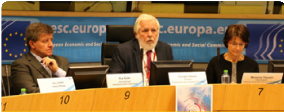
Vasemmalta oikealle: ILO:n pääjohtaja Guy Ryder, ETSK:n puheenjohtaja Georges Dassis ja EU-komissaari Marianne Thyssen "Työn tulevaisuus" kampanjan lehdistötilaisuudessa.

ETSK ja Kansainvälinen työjärjestö (ILO) järjestivät 15.–16. marraskuuta 2016 Brysselissä korkean tason vuoropuhelun aiheesta "Työn tulevaisuus". Se keräsi yhteen yli 300 osallistujaa, jotka edustivat Euroopan työmarkkinaosapuolia ja kansalaisyhteiskuntaa. ETSK:n puheenjohtaja Georges Dassis, äskettäin uudelleen valittu ILO:n pääjohtaja Guy Ryder ja Euroopan komission jäsen Marianne Thyssen käyttivät avausistunnossa puheenvuoron.