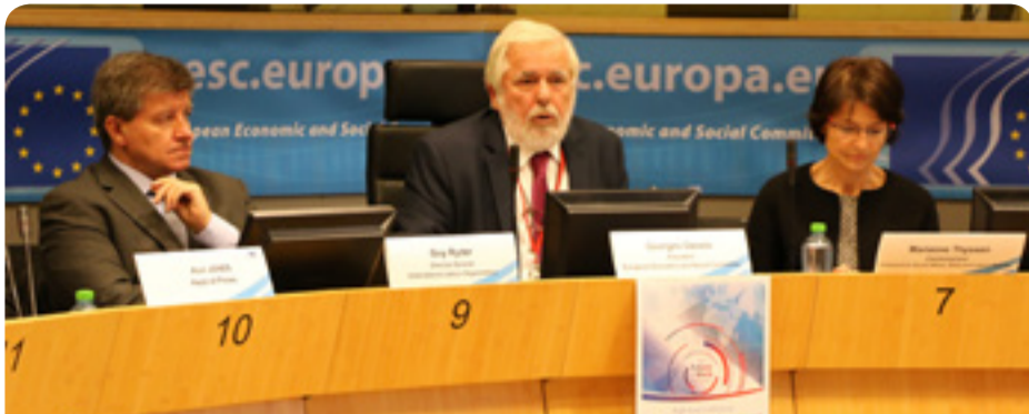
Fra venstre til højre: ILO's generaldirektør, Guy Rider, EØSU's formand, Georges Dassis, og kommissær Marianne Thyssen på pressekonferencen om fremtidens arbejde

Den 15.-16. november 2016 afholdt EØSU og Den Internationale Arbejdsorganisation (ILO) en dialog på højt niveau i Bruxelles om fremtidens arbejdsliv . Mere end 300 repræsentanter for Europas arbejdsmarkedsparter og civilsamfundet deltog. EØSU's formand Georges Dassis, ILO's nyligt genvalgte generaldirektør Guy Rider, og EU-kommissær Marianne Thyssen talte på åbningsmødet.