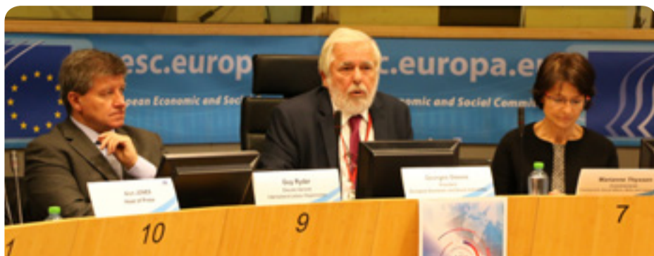
От ляво надясно: генералният директор на МОТ Гай Райдър, председателят на ЕИСК Жорж Дасис и европейският комисар Мариан Тейсен на пресконференцията „Бъдещето на труда“

На 15 и 16 ноември 2016 г. ЕИСК и Международната организация на труда (МОТ) проведоха в Брюксел диалог на високо равнище относно бъдещето на труда. Участваха над 300 представители на европейските социални партньори и гражданското общество. При откриването изказвания направиха председателят на ЕИСК Жорж Дасис, преизбраният на поста си генерален директор на МОТ Гай Райдър и европейският комисар Мариан Тейсен.