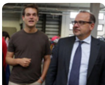
Konferenco sta organizirali skupina delodajalcev in združenje delodajalcev Slovaške