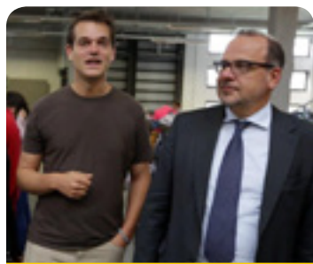
Președintele Grupului „Activități diverse”, dl Luca Jahier, împreună cu directorul întreprinderii Les Petits Riens , dl Julien Coppens

În septembrie, președintele Grupului „Activități diverse”, dl Luca Jahier, a vizitat întreprinderea socială Les Petits Riens din Belgia. Contribuția economică esențială a economiei sociale este puțin cunoscută, aceasta reprezentând însă locuri de muncă pentru peste 14 milioane de europeni, adică 6,5 % din populația activă. Întreprinderile sociale precum Les Petits Riens nu sunt organizații de caritate, ele sunt lucrative, ca orice IMM, contribuind în mod direct la crearea de locuri de muncă și creșterea economică și furnizând servicii de maximă necesitate. Cu toate acestea, diferența esențială este că obiectivul lor principal este de natură socială: fie în ce privește serviciile pe care le furnizează, fie metodele utilizate. Pentru Grupul „Activități diverse”, acest sector are o rezonanță puternică și potențialul de a furniza publicului servicii pe care poate statul nu este în măsură să le ofere, iar în ultimii 15 ani, CESE