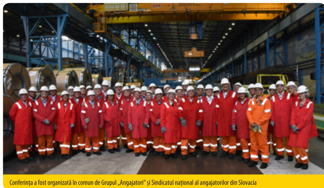
Conferința a fost organizată în comun de Grupul „Angajatori” și Sindicatul național al angajatorilor din Slovacia

La rândul nostru, vrem să ne exprimăm sprijinul deplin pentru toți lucrătorii, toate organizațiile sindicale, toți oamenii politici și toți investitorii care se mobilizează pentru a asigura un viitor acestei regiuni care a fost deja grav afectată de criză, ajungând într-o situație de precaritate.