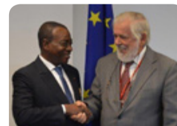
Uścisk dłoni przewodniczącego EKES-u Georges'a Dassisa i Charles'a Koffi Diby'ego, przewodniczącego RSG Wybrzeża Kości Słoniowej

Spotkanie było okazją do dyskusji na tematy będące przedmiotem wspólnego zainteresowania i zaowocowało decyzją o podjęciu wspólnych działań. Georges Dassis zadeklarował, że EKES jest gotów doradzać Radzie Społeczno-Gospodarczej Wybrzeża Kości