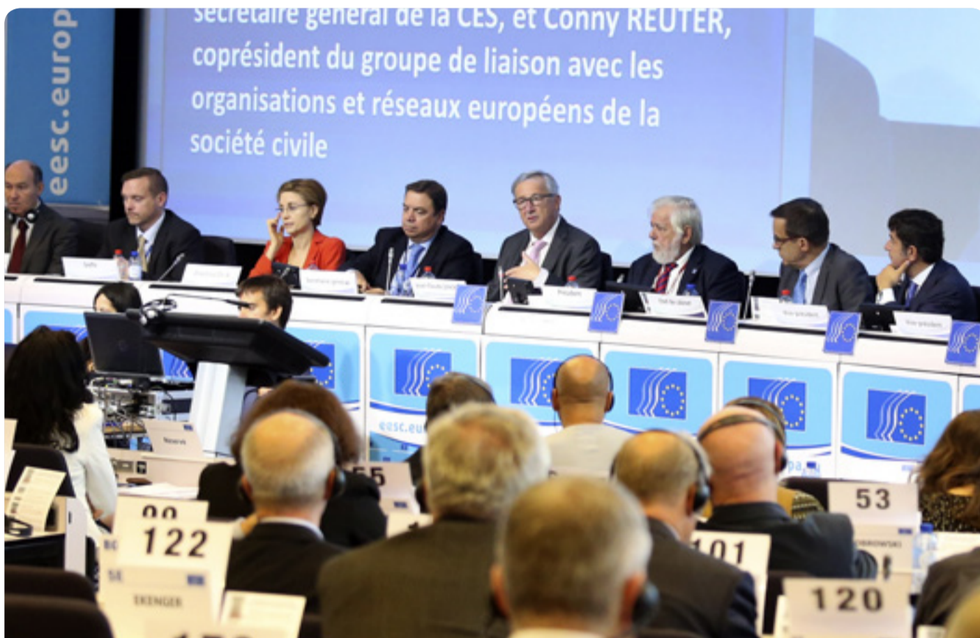
Przewodniczący Komisji Europejskiej Jean-Claude Juncker i przewodniczący EKES-u Georges Dassis w czasie debaty na sesji plenarnej EKES-u

EKES ma do odegrania w negocjacjach nad TTIP ważną rolę instytucjonalną. Celem opinii jest wypracowanie podejścia do polityki handlowej opartego na współpracy między Komisją Europejską a społeczeństwem obywatelskim. (mm)