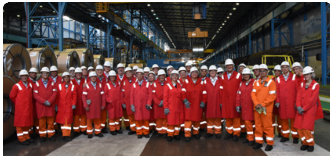
De conferentie werd georganiseerd door de groep Werkgevers en de Slowaakse werkgeversbond

Ook wij willen onze steun uitspreken voor alle werknemers, vakbondsorganisaties, politici en investeerders die in actie komen om deze regio, die door de crisis toch al een zeer hachelijke tijd doormaakt, een toekomst te bieden.