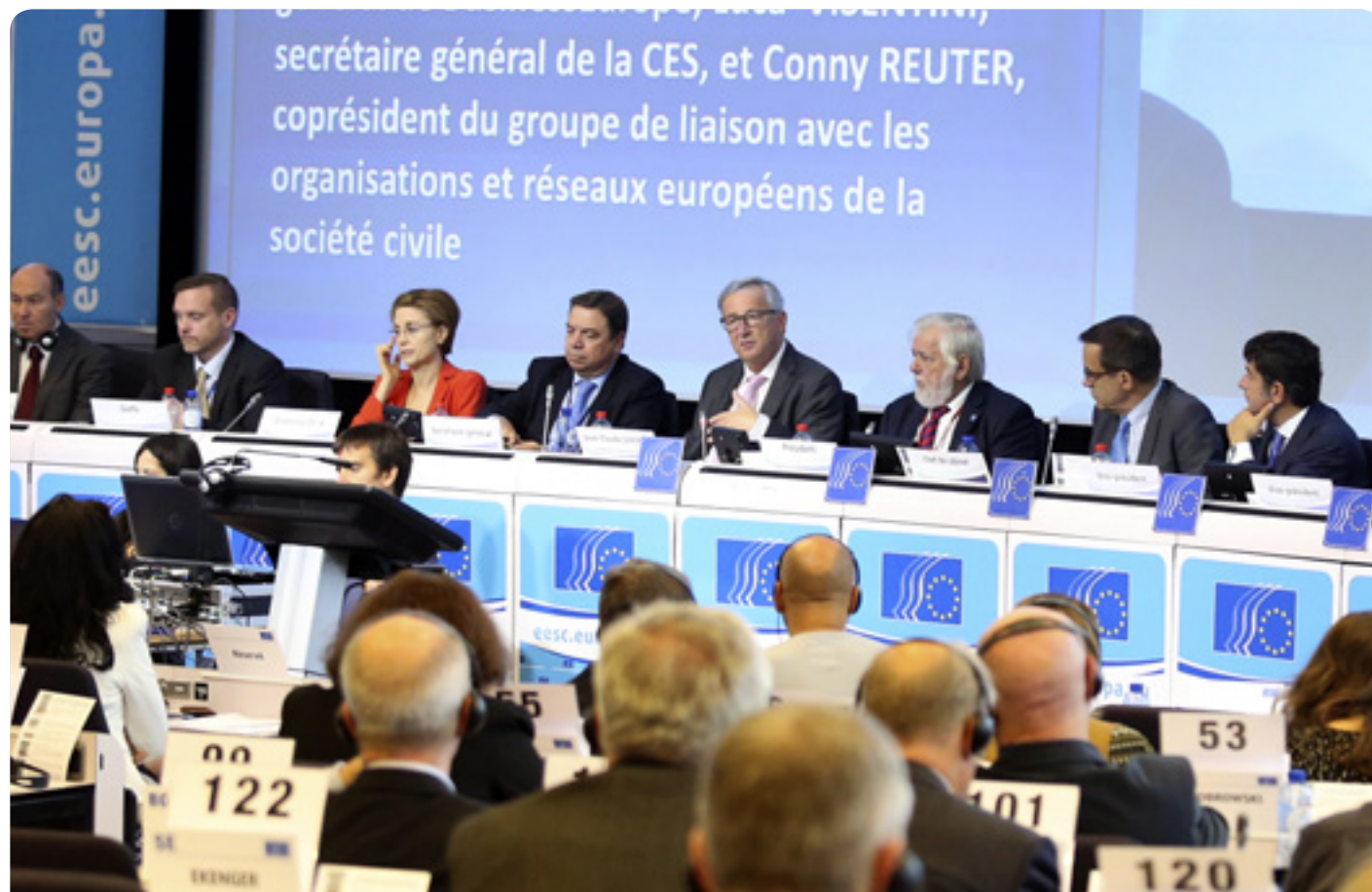
Commissievoorzitter Jean-Claude Juncker en EESC-voorzitter Georges Dassis tijdens het debat in de plenaire vergadering