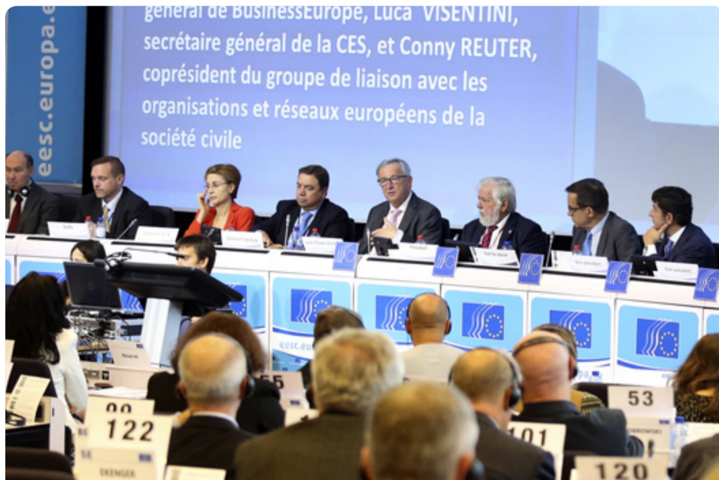
Il-President tal-Kummissjoni Ewropea, Jean-Claude Juncker u l-President tal-KESE, Georges Dassis waqt id-dibattitu fil-plenarja tal-KESE

Il-KESE għandu rwol istituzzjonali importanti x'jaqdi fin-negozjati tat-TTIP. L-għan ta' din l-opinjoni huwa li jiġi żvilupp appoċċ kooperattiv għall-politika kummerċjali bejn il-Kummissjoni Ewropea u s-soċjetà civili. (mm)