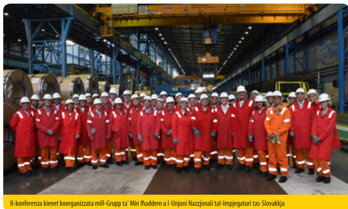
Il-konferenza kienet koorganizzata mill-Grupp ta' Min Ihaddem u l-Unjoni Nazzjonali tal-Impjegaturi tas-Slovakkja

Aħna wkoll nixtiequ nesprimu l-apoġġ sħiħ tagħna għal dawn il-haddiema kollha, l-organizzazzjonijiet tat-trejdjunjins, il-politiċi u l-investituri li qed jorganizzaw ruħhom biex jiġi żgurat gejjieni għal dan ir-reġjun diġà milqut b'mod gravi mill-kriżi li qed tressaq lil reġjun sħiħ lejn sitwazzjoni prekarja.