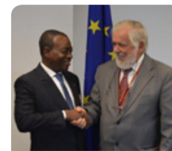
Georges Dassis EGSZB-elnök kezét fog Charles Koffi Dibyvel, az Elefántcsontparti Gsz elnökével

Az eredményes tapasztalatcsere lehetőséget biztosított a közös érdeklődésre számot tartó kérdések megvitatására, és döntést születtet közös tevékenységek megvalósításáról is. Georges Dassis elmondta, hogy az EGSZB kész tanácsot adni az elefántcsontparti gsz számára működési kérdésekről, valamint megosztani vele tapasztalatait a gazdasági és szociális tanácsok által gyakorolt hatást illetően, hogy a gszt a lehető leghatékonyabban végezhesse munkáját a civil társadalom érdekében. (mm)