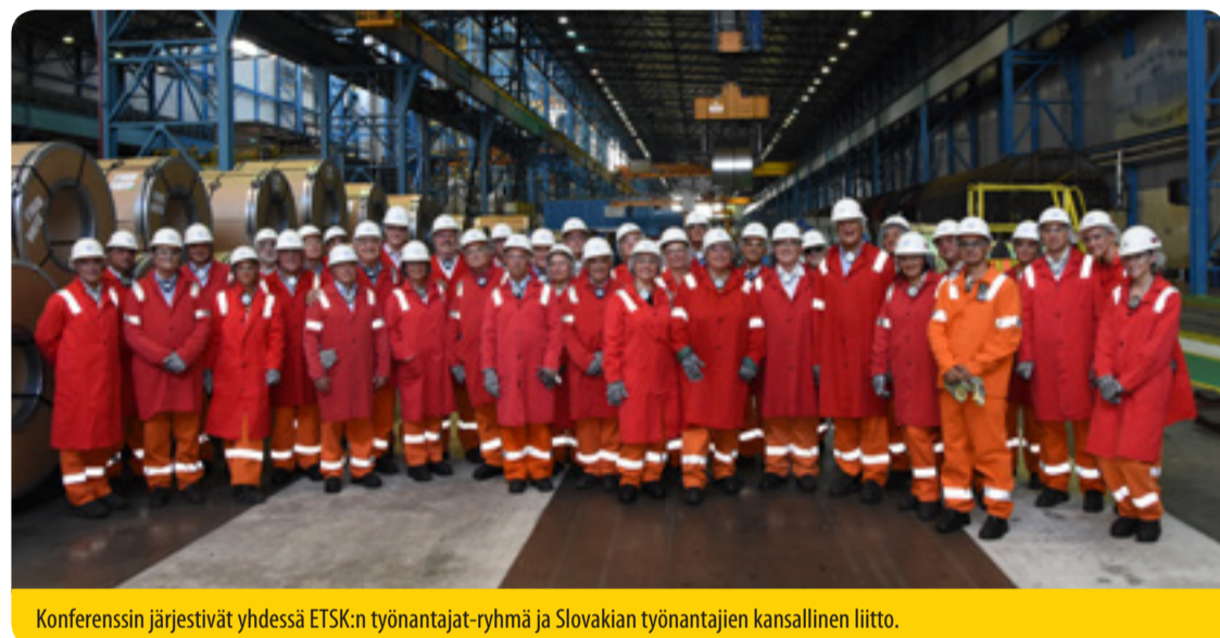
Konferenssin järjestivät yhdessä ETSK:n työnantajat-ryhmä ja Slovakian työnantajien kansallinen liitto.

Caterpillar on päättänyt siirtää toimintansa Grenobleen Ranskaan. Ranskalaiset työntekijät ovat jo ilmaisseet solidaarisuutensa