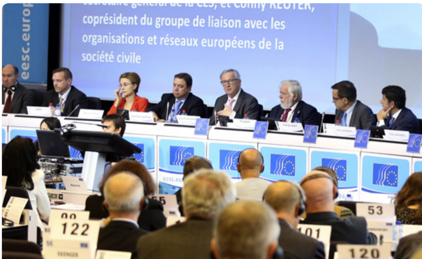
Euroopan komission puheenjohtaja Jean-Claude Juncker ja ETSK:n puheenjohtaja Georges Dassis ETSK:n täysistuntokeskustelun aikana

ETSK:lla on TTIP-neuvotteluissa tärkeä asema. Tämän lausunnon tarkoituksena on kehittää Euroopan komission ja kansalaisyhteiskunnan yhteistyöhön perustuva lähestymistapa kauppapolitiikkaan. (mm)