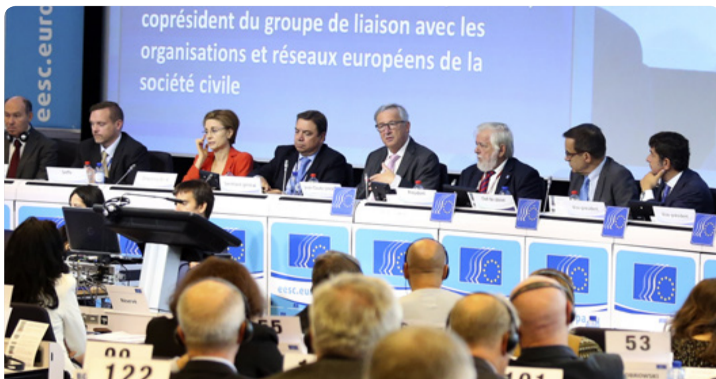
Ο Πρόεδρος της Ευρωπαϊκής Επιτροπής, ο Jean-Claude Juncker και ο Πρόεδρος της ΕΟΚΕ, κ. Γιώργος Ντάσης, κατά τη διάρκεια της συζήτησης στη σύνοδο ολομέλειας της ΕΟΚΕ

Ιδιαίτερη προσοχή δίδεται στα κεφάλαια της ΕΕ σχετικά με τη ρυθμιστική συνεργασία, τη διευκόλυνση των τελωνειακών διαδικασιών και των συναλλαγών, το εμπόριο και την αειφόρο ανάπτυξη, τα τεχνικά εμπόδια στις συναλλαγές καθώς και την υγειονομική και φυτοϋγειονομική προστασία (ΥΦΠ). Η γνωμοδότηση της ΕΟΚΕ τονίζει πόσο σημαντικό είναι να διασφαλιστεί ότι η ρυθμιστική συνεργασία (η οποία επηρεάζει, σύμφωνα με εκτιμήσεις, το 76% περίπου του αντικτύπου της ΤΤΙΡ στην αειφορία) βελτιώνει αντί να υπονομεύει τα κοινωνικά, εργασιακά και περιβαλλοντικά πρότυπα.