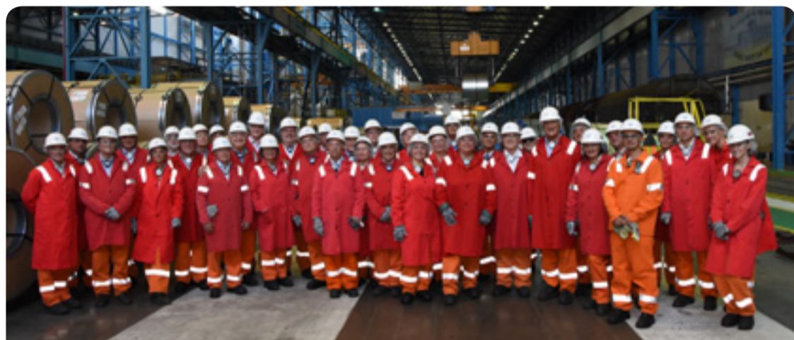
Η διάσκεψη συνδιοργανώθηκε από την Ομάδα των Εργοδοτών και την Εθνική Ένωση Εργοδοτών της Σλοβακίας