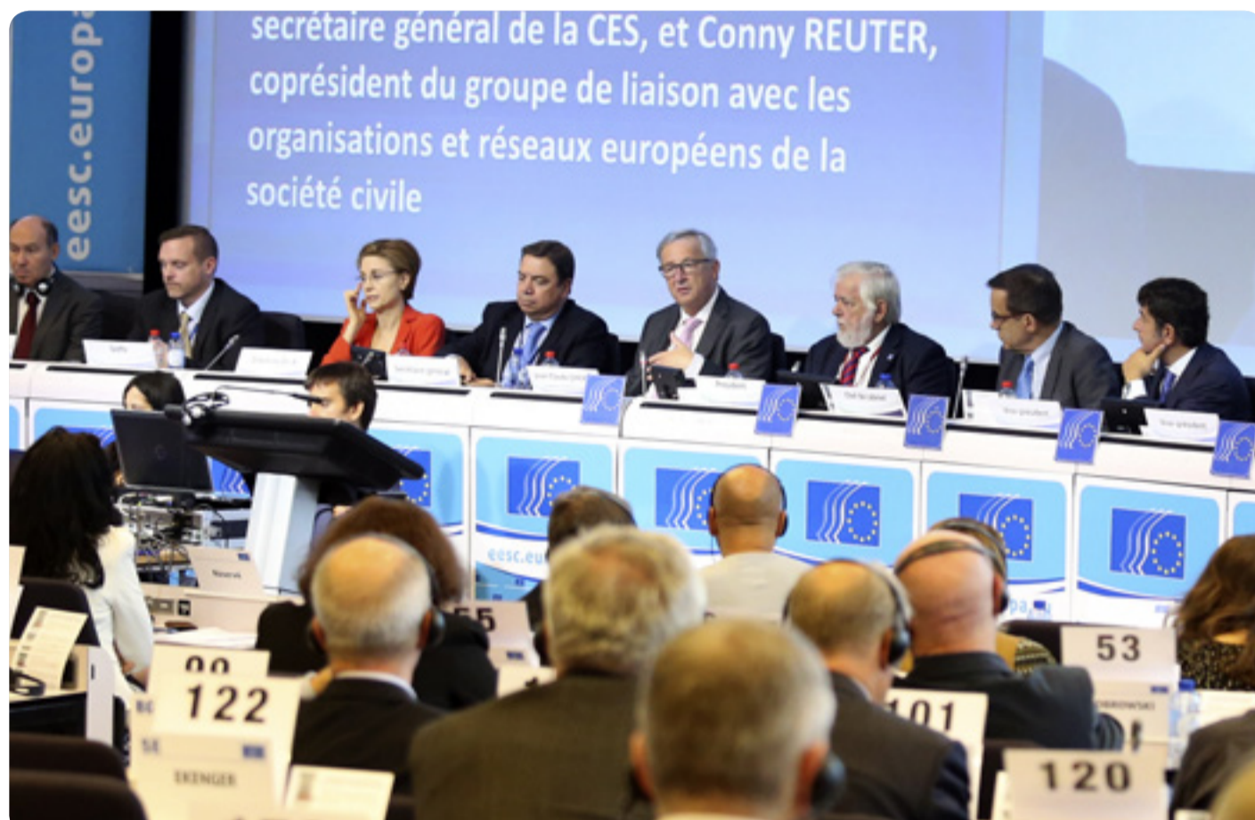
Kommissionens formand, Jean-Claude Juncker, og EØSU's formand, Georges Dassis, under debatten på EØSU's plenarforsamling

EØSU spiller en særlig rolle som institution i forbindelse med TTIP-forhandlingerne. Formålet med denne udtalelse er at udvikle et mere målrettet samarbejde om handelspolitikken mellem Europa-Kommissionen og civilsamfundet. (mm)