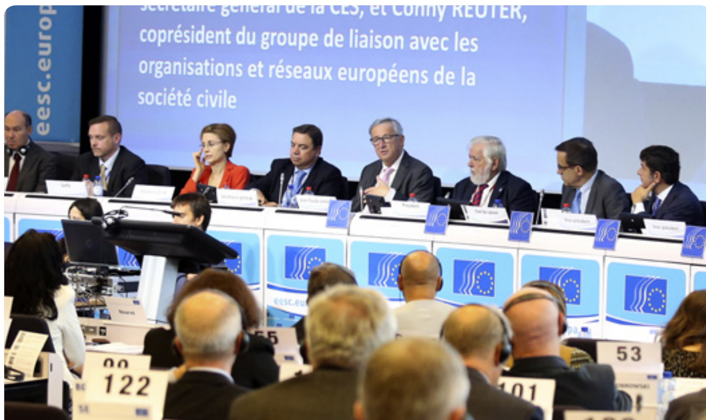
Председателят на Европейската комисия Жан-Клод Юнкер и председателят на ЕИСК Жорж Дасис на пленарната сесия на ЕИСК

ЕИСК има важна институционална роля в преговорите по ТПТИ. Целта на това становище е да се разработи основан на сътрудничество подход към търговската политика, който да се прилага от Европейската комисия и организациите на гражданското общество. (mm)