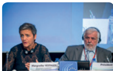
Margrethe Vestager, Kummissarju tal-UE għall-Kompetizzjoni u Georges Dassis, il-President tal-KESE

"L-UE hija dwar niesha. Hija dwar il-bżonn li ninghaqdu flimkien biex insibu soluzzjonijiet għal problemi komuni", qalet il-Kummissarju Vestager, "[f'dan il-Kumitat], intom tittrattaw kwistjonijiet li jaffettwaw il-hajja ta' kuljum tan-nies [...] u li wiehed jifhem x'jehtieg li jsir sabiex tgħinuuhom. L-Opinjoni tagħkom dwar Ir-Rapport tal-Kompetizzjoni Annwali għall-2014 tagħna tibda b'punt li jien nahseb huwa fundamentali: il-kompetizzjoni tgħin lil kulhadd. Mhux biss lill-konsumaturi iżda anke lill-impriži u lill-haddiema."