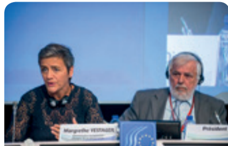
ELi konkurentsivolinik Margrethe Vestager ja EMSK president Georges Dassis

Komitee liikmed väljendasid poolehoidu volinik Vestageri järgitavale poliitikale ning juhtisid tähelepanu praegustele Hiinaga seonduvatele probleemidele terase- ja raudteetööstuses. Käsitleti ka sotsiaalset dumpingut, samuti