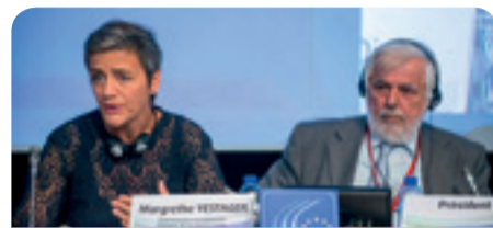
Margrethe Vestager, comisaria europea de Competencia, y Georges Dassis, presidente del CESE

sectores anteriormente dominados por monopolios nacionales.