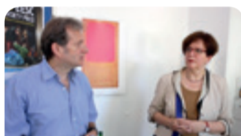
Η κ. Gabriele Bischoff, Πρόεδρος της Ομάδας Εργαζομένων της ΕΟΚΕ, σε επίσκεψή της στην οργάνωση «Armut und Gesundheit in Deutschland», που έλαβε, το 2015, το Βραβείο της Κοινωνίας των Πολιτών που απονέμει η ΕΟΚΕ

Η φτώχεια έχει πολλές μορφές: ανεργία, έλλειψη στέγης, πενιχρές ή μηδανικές ευκαιρίες εκπαίδευσης, υλικούς περιορισμούς, κακή υγεία, κλπ. Η αποστολή που έχει θέσει στον εαυτό του ο ιδρυτής και διευθυντής της οργάνωσης αυτής στο Mainz, καθηγητής κ. Gerhard Trabert, είναι να βοηθά τους φτωχούς να ανακτήσουν την υγεία τους. Οδηγεί ένα αυτοκίνητο-ιατρείο για να επισκέπτεται τους αστέγους και τους κοινωνικά ευάλωτους. Η οργάνωση ασχολείται πολύ, επίσης, με την παροχή συμβουλών σχετικά με κοινωνικά ζητήματα, ειδικά για την ασφάλιση και την (επαν)ένταξη στην κοινωνία. Η κ. Bischoff έχει ακούσει πολλές θλιβερές ιστορίες, πολλές από τις οποίες αφορούν εργαζόμενους που προσλήφθηκαν με ψευδή προσήματα για να εργαστούν ως «ψευδοαυτοαπασχολούμενοι», μη γνωρίζοντας ότι δεν είχαν