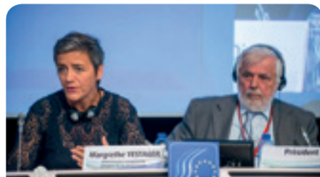
Η κ. Margrethe Vestager, Επίτροπος Ανταγωνισμού της ΕΕ, και ο κ. Γιώργος Ντάσης, Πρόεδρος της ΕΟΚΕ

Τα μέλη της ΕΟΚΕ εξέφρασαν την υποστήριξη τους στην πολιτική που ακολουθεί η Επίτροπος κ. Vestager και αναφέρθηκαν ιδιαίτερα στα ζητήματα που