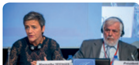
Маргрете Вестегер, европейски комисар по конкуренцията и Жорж Дасис, председател на ЕИСК

Членовете на ЕИСК изразиха подкрепата си за политиката, следвана от комисар Вестегер, и изтъкнаха