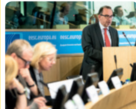
President tal-Grupp ta' Interessi Varji tal-KESE waqt il-konferenza "Tama għall-Ewropa! Kultura, bliet u narrattivi ġodda"

il-kultura bħala r-4 pilastru tal-Iżvilupp Sostenibbli