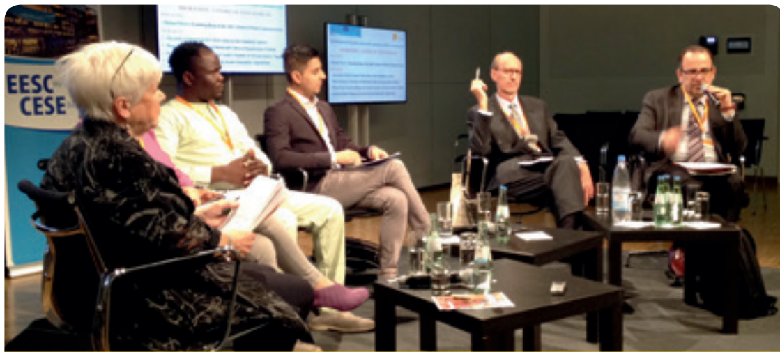
EESK Dažādu interešu grupas priekšsēdētājs Luca Jahier Pasaules plašsaziņas līdzekļu forumā Bonnā