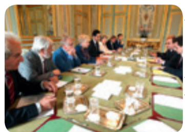
«Περιμένω πολλά από την υποστήριξη του Προέδρου κ. François Hollande για την