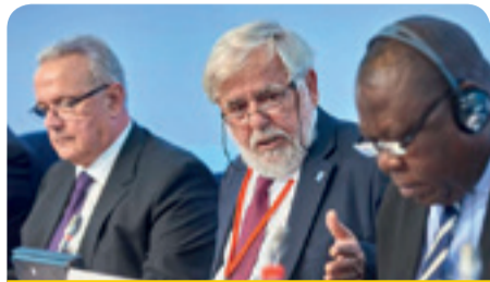
Ο κ. Γιώργος Ντάσης, Πρόεδρος της ΕΟΚΕ, με τον κ. Joseph Chilengi, Προεδρεύοντα του ECOSOCC της Αφρικανικής Ένωσης, και τον Επίτροπο Neven Mimica

Χρειάζεται μια νέα εταιρική σχέση ΕΕ-ΑΚΕ με οδηγό την κοινωνία των πολιτών