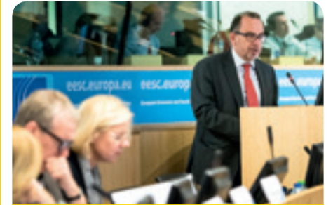
Luca Jahier, Πρόεδρος της Ομάδας «Διάφορες Δραστηριότητες», ομιλεί στη διάσκεψη

ο πολιτισμός ως ο 4ος πυλώνας της βιώσιμης ανάπτυξης