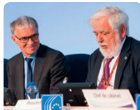
Ο κ. Γιώργος Ντάσης, Πρόεδρος της ΕΟΚΕ, και ο κ. Patrick Bernasconi, Πρόεδρος του Οικονομικού, Κοινωνικού και Περιβαλλοντικού Συμβουλίου της Γαλλίας

Οικονομικές και Κοινωνικές Επιτροπές και οι προσδοκίες της ευρωπαϊκής κοινωνίας των πολιτών , και συμμετείχε στις συζητήσεις των μελών της ΕΟΚΕ σχετικά με το ζήτημα αυτό, που έχει καίρια σημασία για τους Ευρωπαίους πολίτες και για όσους εκπροσωπούν τις οργανώσεις τους σε όλα τα επίπεδα.