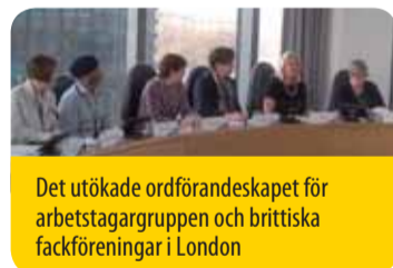
Det utökade ordförandeskapet för arbetstagargruppen och brittiska fackföreningar i London

Deltagarna betonade den gynnsamma tidpunkten för en studie som genomförts av Labour Research Department på begäran av Arbetstagargruppen, och som publicerades samtidigt som den brittiska regeringen lade fram ett lagförslag om fackföreningar som innebar den största attacken på fackföreningsrättigheter på 30 år. I studien ( The crisis and the Evolution of Labour Relations in the UK , tillgänglig via: http://www.eesc.europa .