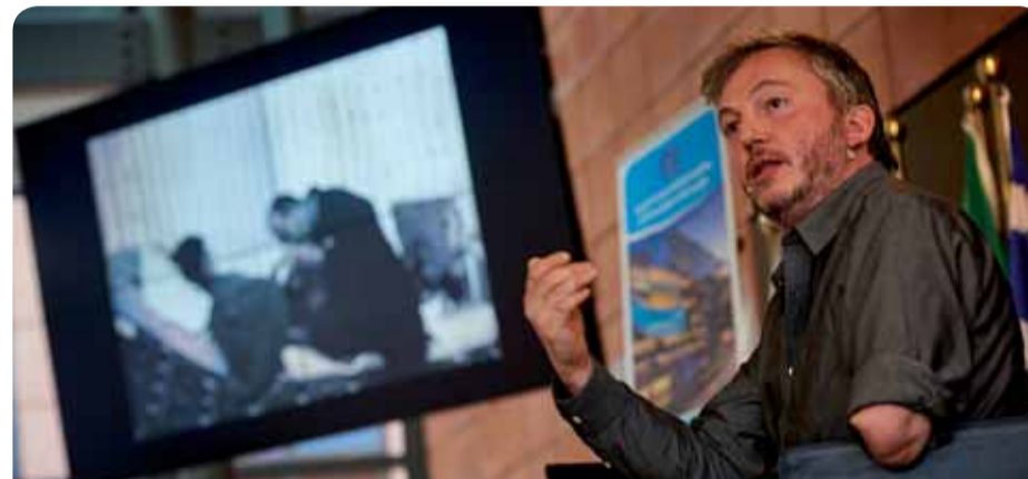
Giles Duley at the EESC

Som en uppföljning av dess arbete med flyktingar och migration står EESK just nu värd för en utställning med fotografier av den internationellt erkände bildjournalisten och före detta krigskorrespondenten Giles Duley som porträtterar de många män, kvinnor och barn som har tagit sig över Medelhavet och kommit fram till den grekiska ön Lesbos.