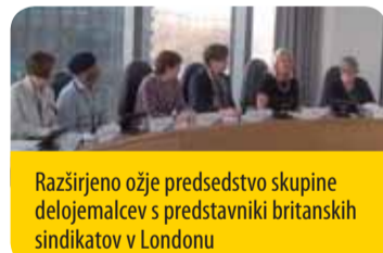
Razširjeno ožje predsedstvo skupine delojemalcev s predstavniki britanskih sindikatov v Londonu

delojemalcev opravil oddelek za raziskave o delovni sili (Labour Research Department) in ki je prišla v pravem trenutku, saj je bila objavljena ravno tedaj, ko je britanska vlada predložila osnutek zakona o sindikatih, ki je pomenil največje teptanje njihovih pravic v zadnjih 30 letih. Študija o krizi in razvoju odnosov med delojemalci in delodajalci v Veliki Britaniji ( The crisis and the Evolution of Labour Relations