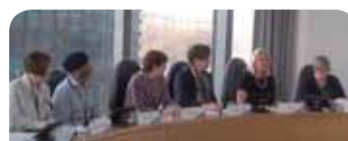
Președinția extinsă a Grupului „Lucrători” și reprezentanții ai sindicatelor britanice, la Londra

Pentru a obține o imagine de ansamblu a diferitelor necesități și situații din toate statele membre ale UE, Comitetul va efectua o serie de misiuni de observare până în septembrie 2016, în cadrul cărora se va întâlni cu partenerii sociali și cu organizațiile ale societății civile. Rezultatele vor fi valorificate în cadrul consultării Comisiei cu privire la pilonul european al drepturilor sociale, propunându-se măsuri în domeniul ocupării forței de muncă și al politicilor sociale, în special în ceea ce privește egalitatea de șanse și accesul la piața forței de muncă, condițiile de muncă echitabile și o protecție socială adecvată și durabilă pentru toți. CESE s-a asociat cu Comisia Europeană pentru a garanta că această consultare ia în considerare punctele de vedere ale societății civile. Comitetul este hotărât să monitorizeze acest proces și să se asigure că pilonul devine operațional prin recurgerea la instrumente adecvate și obligatorii din punct de vedere juridic – aceasta fiind singura cale pe care se poate ajunge la progres social în Europa. (cad)