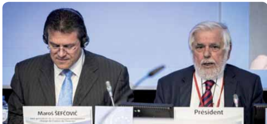
Vicepreședintele Comisiei Europene, dl Maroš Šefčovič, și președintele CESE, dl Georges Dassis

Avizul CESE privind starea uniunii energetice 2015 (raportor: dl Stéphane Buffetout, Grupul „Angajatori”), adoptat în sesiunea plenară a CESE din aprilie, solicită punerea unui accent mai puternic asupra dimensiunii sociale a uniunii energetice și îndeamnă Comisia să includă această dimensiune printre criteriile de evaluare ale următorului raport anual.