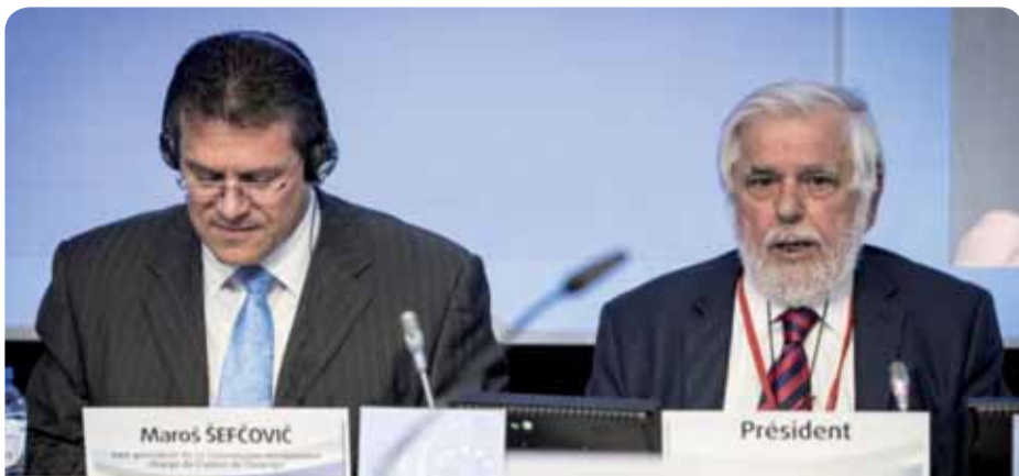
Vicevoorzitter Maroš Šefčovič van de Europese Commissie en EESC-voorzitter Georges Dassis

In zijn advies over de Stand van de energie-unie 2015 (rapporteur: Stéphane Buffetaut, groep Werkgevers), dat tijdens de zitting in april werd goedgekeurd, dringt het EESC erop aan meer aandacht te besteden aan de maatschappelijke dimensie van de energie-unie, en verzoekt het de Commissie deze dimensie in het volgende jaarverslag op te nemen bij de evaluatiecriteria.