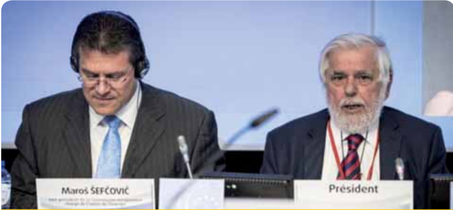
il-Viċi President tal-Kummissjoni s-Sur Maroš Šefčovič u l-President tal-KESE s-Sur Georges Dassis