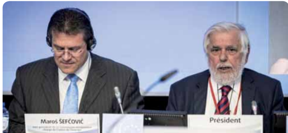
Komisijas priekšsēdētāja vietnieks Maroš Šefčovič un EESK priekšsēdētājs Georges Dassis