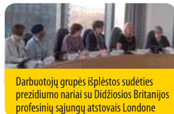
Darbuotojų grupės išplėtos sudėties prezidiumo nariai su Didžiosios Britanijos profesinių sąjungų atstovais Londone

Dalyviai pasidžiaugė, kad Darbo tyrimų departamentas ( Labour Research Department ) Darbuotojų grupės prašymu pačiu laiku atliko tyrimą, kuris buvo paskelbtas, kai Jungtinės Karalystės vyriausybė pateikė profesinių sąjungų teisės akto projektą, kuris bene labiausiai per pastaruosius 30 metų suvaržo profesinių sąjungų teises. Šiuo tyrimu „Krizė ir darbo santykių raida Jungtinėje Karalystėje“ ( The crisis and the Evolution of Labour Relations