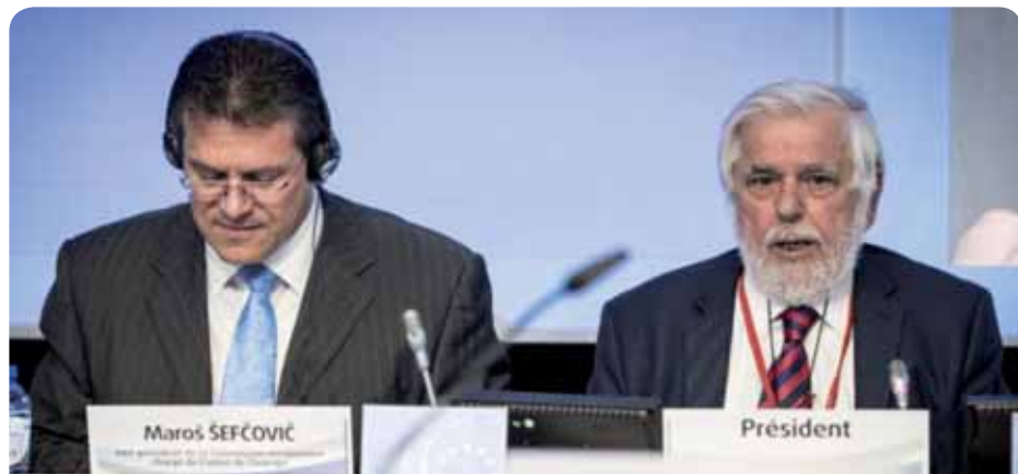
Komisijos pirmininko pavaduotojas Maroš Šefčovič ir EESRK pirmininkas Georges Dassis