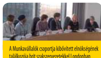
A Munkavállalók csoportja kibővített elnökségének találkozója brit szakszervezetekkel Londonban

A résztvevők kiemelték, hogy a Munkavállalók csoportjának felkérésére a Munkaügyi Kutatói Részleg (Labour Research Department) kitűnő időzítéssel készített tanulmányt, amelyet éppen akkor tettek közzé, amikor az Egyesült Királyság kormánya előterjesztett egy olyan szakszervezeti törvényt, amelynél az elmúlt harminc évben egyetlen intézkedés sem csorbította jobban a szakszervezeti jogokat. Ez a tanulmány ( The crisis and the Evolution of Labour Relations in the UK [A válság és a munkaügyi kapcsolatok