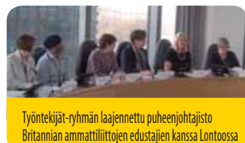
Työntekijät-ryhmän laajennettu puheenjohtajisto Britannian ammattiliittojen edustajien kanssa Lontoossa

Kokouksen osallistajat korostivat työntekijät-ryhmän Labour Research Department -tutkimuslaitoksella teettämän tutkimuksen erinomaista ajoitusta, sillä tutkimus julkaistiin juuri, kun Yhdistyneen kuningaskunnan hallitus antoi ammattiliittoa koskevan lakiesityksen, joka merkitsee ammattiliittojen oikeuksille suurinta taka-askelta 30 vuoteen. Kyseisessä tutkimuksessa ( The Crisis and the Evolution of Labour Relations in the UK , saatavilla