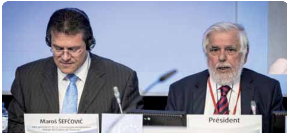
Komission varapuheenjohtaja Maroš Šefčovič ja ETSK:n puheenjohtaja Georgios Dassis